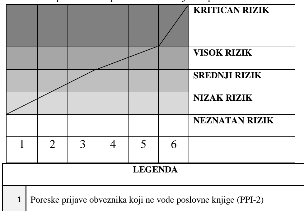
Grafikon procene rizika po osnovu lokalnih javnih prihoda

Procena rizika u inspeksijskom nadzoru u cilju realizacije plana i programa rada Gradske uprave za naplatu javnih prihoda grada Novog Pazara u 2022. godini izvršena je pre svega na osnovu rezultata dobijenih primenom kontrolnih listi u vidu opredeljenog broja bodova i njihovog raspona iskazanog u tabeli za utvrđivanje stepena rizika. Od značaja za procenu rizika su informacije i dobijeni podaci od drugih inspekcija, ovlašćenih organa i organizacija kao i analiza stanja, odnosno iskustva u dosadašnjem vršenju inspeksijskog nadzora.